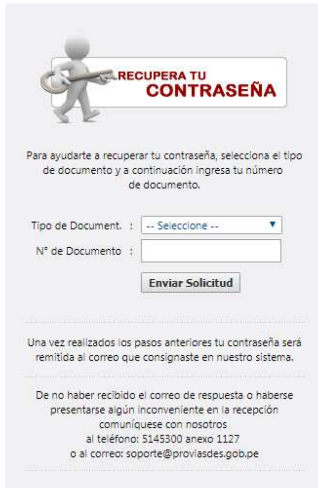
Formulario 2. Recupera tu contraseña

Llene los datos del formulario y Enviar Solicitud. En su correo electrónico le llegará su contraseña.